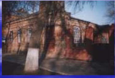
Складское помещение СМК "Знамя Ленина"