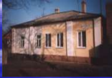
Дом А.В. Якимовского