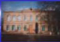
Жилой дом для учителей