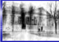
Новое здание СОШ№2