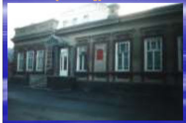
Архитектура и ЗАГС